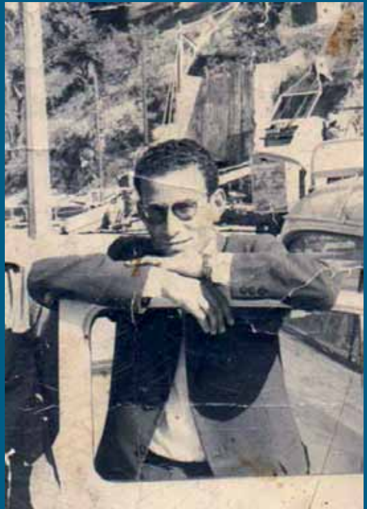
Abdelmalek Sayad, Algérie, années 1960, (collection particulière).